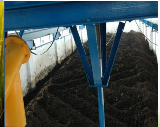
ปุ๋ยอินทรีย์ มทส.