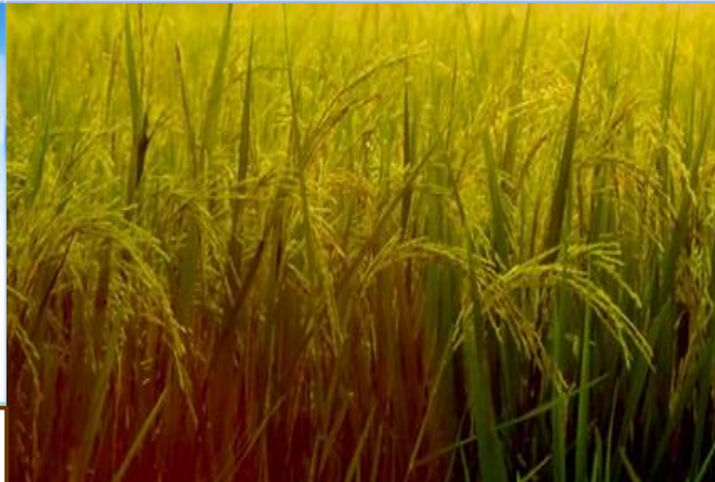
มทส.ช่วยได้ ทำนา หนึ่งไร่ รายได้กว่าแสน