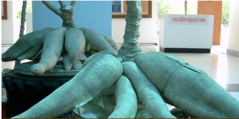
สิบเดือน สิบตัน มัน(สำปะหลัง) มทส.