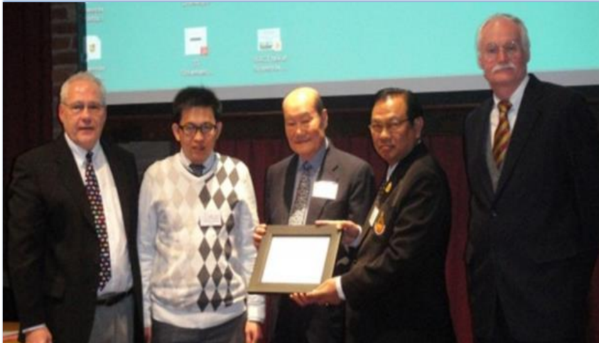
SUT vs WACE