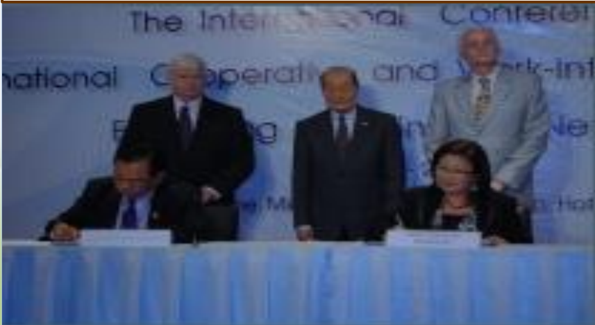
SUT vs Indonesian Univ. Rector Council