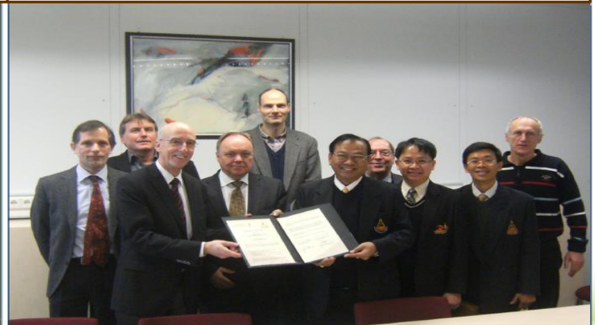
SUT vs German University