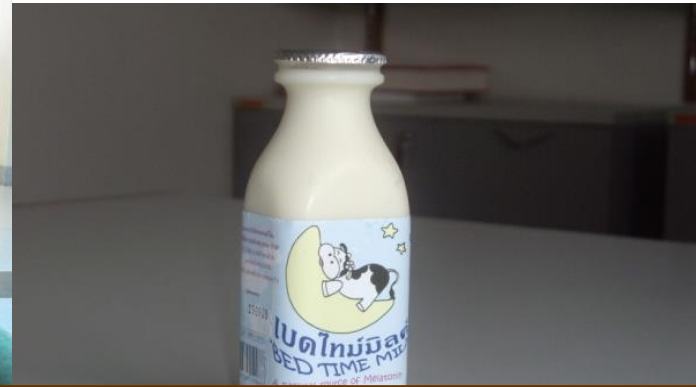
สดทุกหยาด สะอาดทุก หยด นมสด มทส.