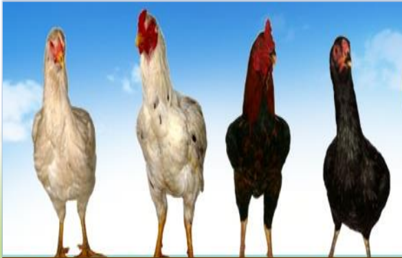
อร่อยเหมือนไก่ไทย โตไวเหมือน ไก่ฝรั่ง ไก่เนื้อ มทส.